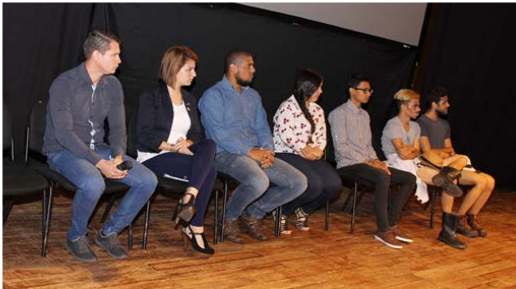
Panel de estudiantes, víctimas de diferentes violaciones a sus derechos

Presentación de “Esperando a Godot” Estudiantes de la Facultad Experimental de Arte de La Universidad del Zulia